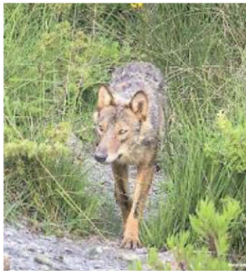
I lupi si avvicinano sempre di più ai centri abitati